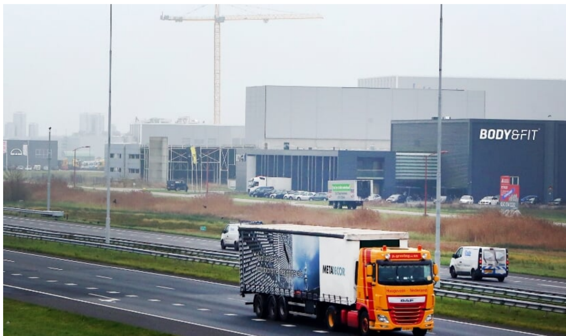
Industrieterrein Heerenveen

HOME AGENDA WEEKBLAD BEDRIJVENGIDS ADVERTEREN BEZORGING FAMILIEBERICHTEN PRO-ACTIEF CONTACT