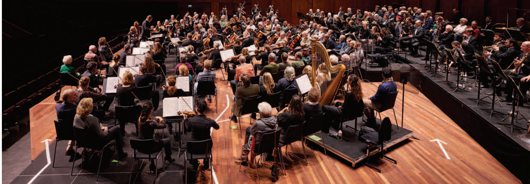
Het Noord Nederlands Orkest speelt werk van Mahler in de grote zaal van De Oosterpoort in Groningen.

naartoe willen me vragen is of er goede scholen in Groningen zijn, en een schouwburg.’”