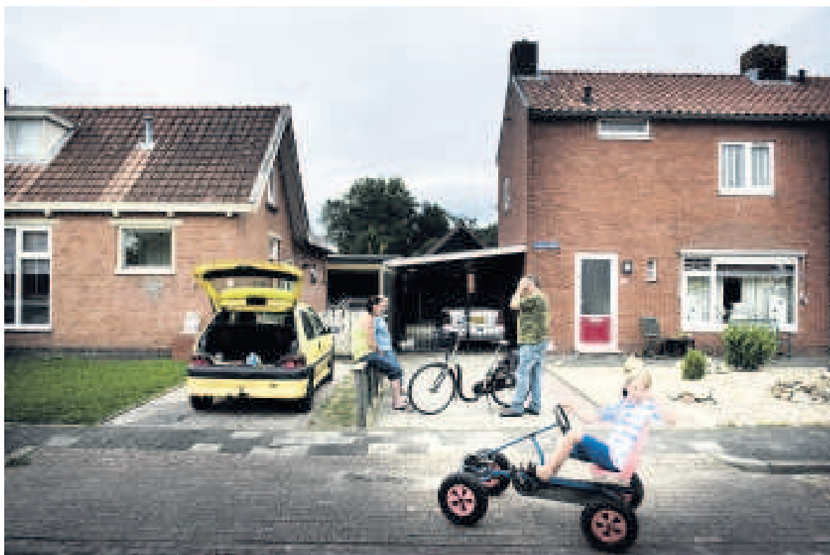
Het nieuwe plan zou wél kans van slagen hebben omdat de initiatieven uit de bevolking zelf komen.

Van Zijl ging in oktober aan de slag met een plan voor Oost-Groningen. In februari sloten de acht betrokken gemeenten, de provincie Groningen en het ministerie van sociale zaken en werkgelegenheid het