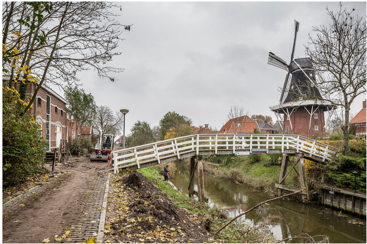
Met gelden uit het Nationaal Programma Groningen wordt de weg langs het water in Mensingeweer gerenoveerd, er komt ook een pleintje.

Ruim een miljard kreeg Groningen vorig jaar om te investeren in toekomstperspectief, als compensatie voor het aardbevingseleed. Maar de eerste miljoenen zijn amper toegekend of er is al discussie over. 'Over twintig